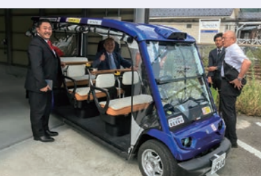
永平寺自動運転視察