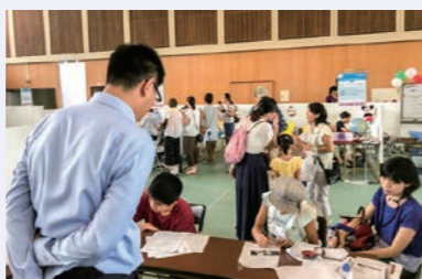
大野キッズタウン