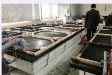
内水面漁業協同組合連合会訪問