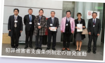
犯罪被害者支援条例制定の啓発運動