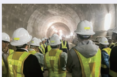
新幹線敦賀駅建設現場視察