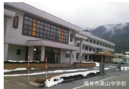
福井市美山中学校

この大きな理由の1つに、他の地域や産業と比較した場合、中山間地域の農業・林業の生産性が低いことがあると思います。また、鳥獣害被害も今なお深刻です。この点、政府は「国土強靱化」を掲げており、中山間地域の保水は保水機能の向上につながり結果として当該地域やその下流域の水害対策にもなるという観点が注目されているところ、保水機能の向上といった国土強靱化の観点での政策目的で予算を確保することが重要になってきます。財務省でも意見交換をしてきたところ、「様々な課題を1つの政策パッケージとして解決するという政策は、今までの農水の政策の中でなかったことと思われ、非常に興味深い。」といった非常に前向きな反応を得たため、それに向けて県の担当部署と共に事業計画を練っていききたいと思えます。