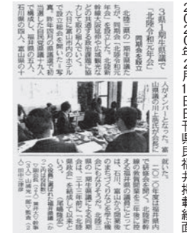
2020年2月11日刊県民福井掲載紙面

新幹線開業等を見据え、これからは福井だけを良くするだけではなく、北陸全体の発展も考えていかなければならないと思います。そこで、北陸3県の1期生が集まり、交流と深めるとともに北陸の課題について一緒に解決していくための会を結成しました。