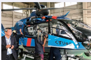
土木警察常任委員会視察