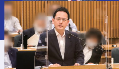
2022年6月21日一般質問にて