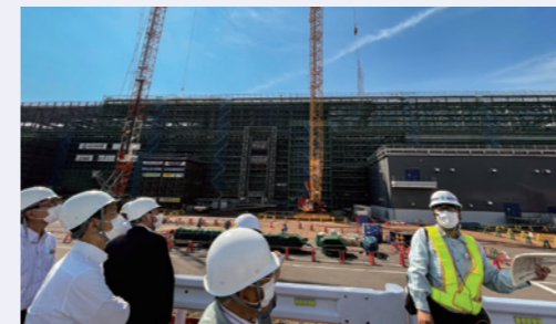
新幹線駅建設現場視察