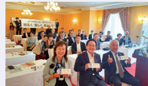
福井市倫理法人会にて